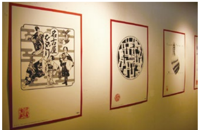
巡回展/セントラルパークギャラリー