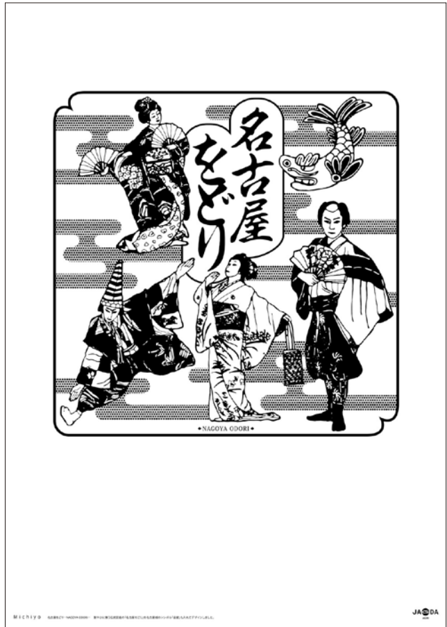
JAGDA/「しるし展〜わたしとしるし in 名古屋城」/本丸御殿「孔雀之間」