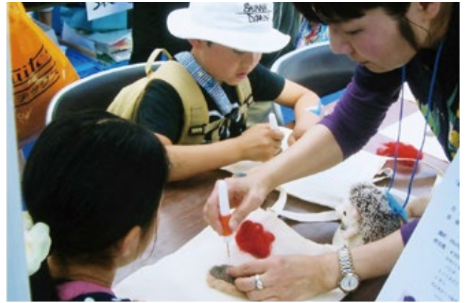
「羊毛フェルトでかわいい動物のエコバッグを作ろう!」/ワークショップ