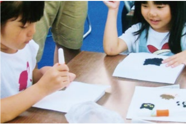
愛知アートフェスタ2017/オアシス21 銀河の広場