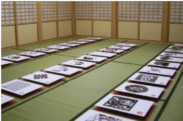
展示会場「孔雀之間」の様子