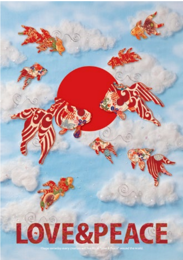
LOVE & PEACE展/POSTER