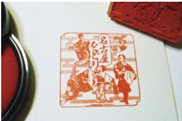
しるしスタンプ/「名古屋をどり」/700x700mm