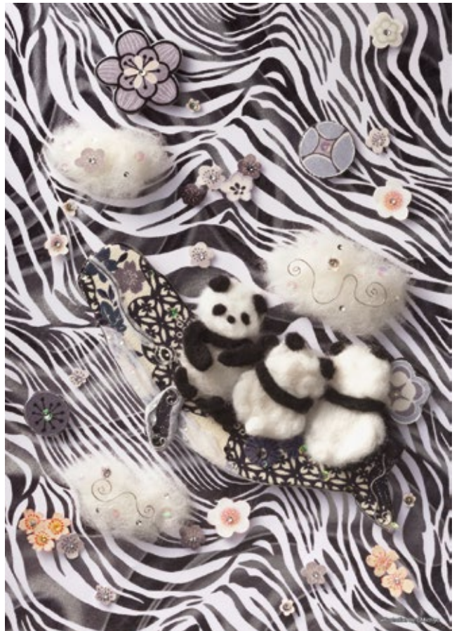
NIC展/「不思議動物園」/愛知県美術館/POSTER