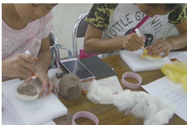
子供会イベント／「羊毛でマスコットを作ろう！」／ワークショップ