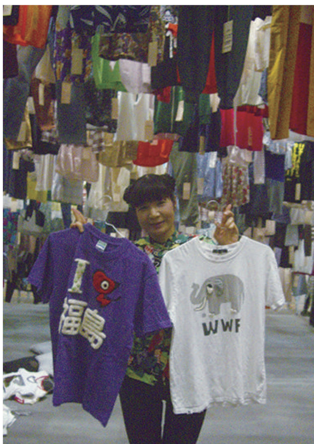
あいちトリエンナーレ・パブロープ関連企画／「みんなで作るアートなリメイク」／展示会場