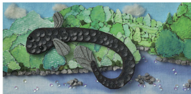
愛知県／「清流長良川流域の生き物・生活・産業」連続講座／イラストレーション