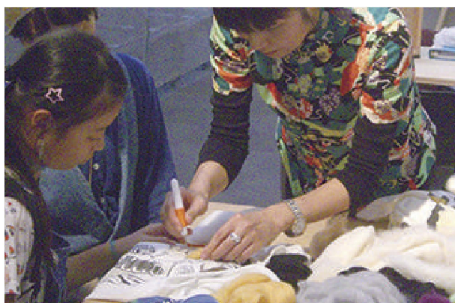
「みんなで作るアートなリメイク」／ワークショップの様子①／愛知県美術館