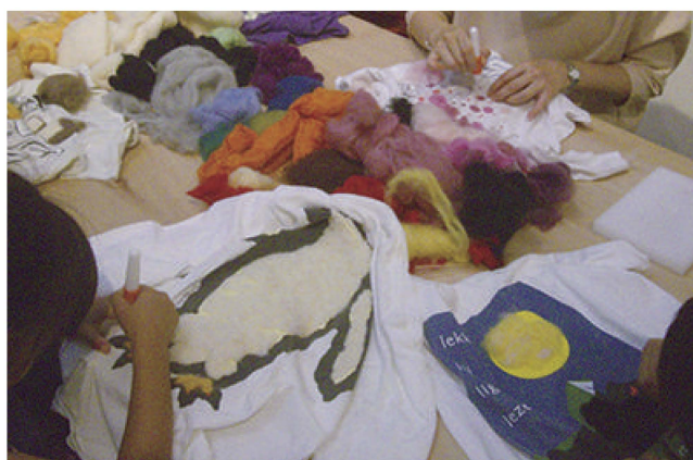
「みんなで作るアートなリメイク」／ワークショップの様子②／愛知県美術館