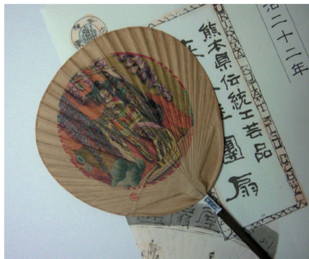
熊本県伝統工芸品／「波うちわ」