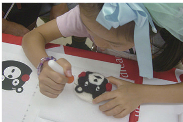
震災復興支援／「くまモンのマスコットを作っちゃおう！」／ワークショップ／名古屋三越