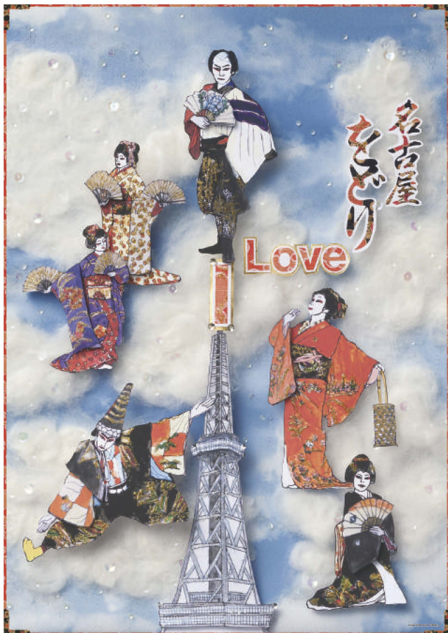
NIC/テレビ塔ABC・XYZ展/「I Love名古屋をどり」/POSTER