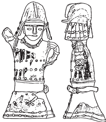
図2 武人埴輪(千葉県殿部田1号墳)

推古朝に位階が制定され、冠は色により位の高下が区別された。以後形や文様、素材等、様々に変化しながら一部現代まで連綿と続いている。烏帽子は公家の略装として始まり、鎌倉時代には武家や