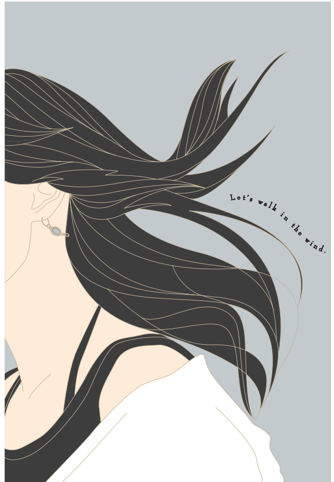
[fig.01] Walk in the wind01/ 名古屋学芸大学メディア造形学部教員展作品展