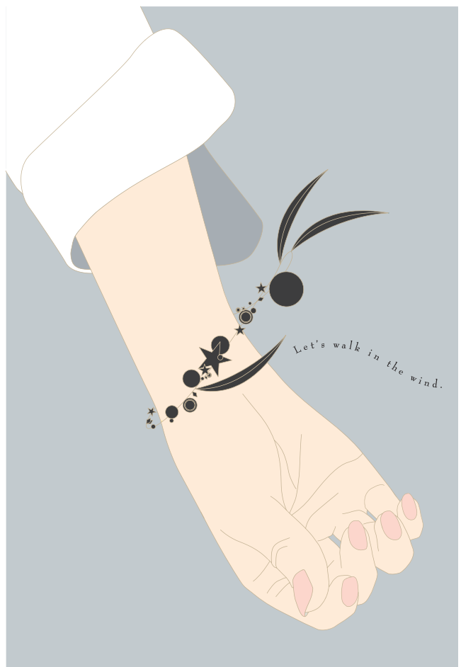
[fig.02] Walk in the wind02/ 名古屋学芸大学メディア造形学部教員展作品展