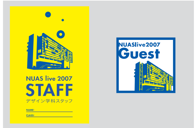
[fig.04] NUAS LIVE contents design/スタッフカード、ゲストシール