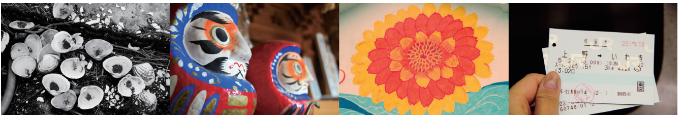
揺れる。shake/sway/quake, 2011年／ブックレットより抜粋