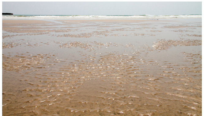
揺れる。shake/sway/quake, 2011年／ビデオキャプチャ・ブックレットより抜粋