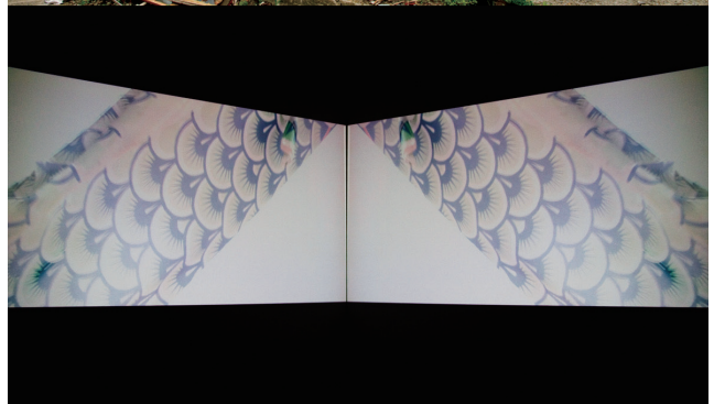
揺れる。shake/sway/quake, 2011年 ビデオキャプチャ・ブックレットより抜粋