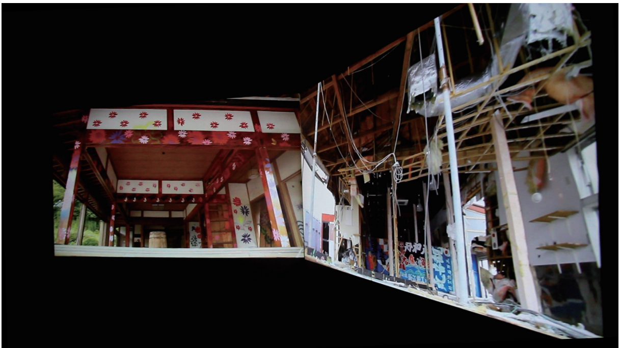
揺れる。shake/sway/quake, 2011年／映像作品: Full HD, 二面プロジェクション 映像撮影場所: JR常磐線 上野～いわき間／福島県いわき市四倉町／久之浜町ほか

未だこの地域では緊急時に使用されるL時放送が続いていた。あの鯉幟をはためかせていた港風が30km先にある瀕死の原子力発電所から「mSv/h」や「 \mu Sv/h」を運んでくる。その数値が刻々とL時放送で伝えられる。子どもの未来のために鯉幟をあげる人と、遠い未来までに及ぶ重い荷物を厭わない人とがここには混雑しているのだ。