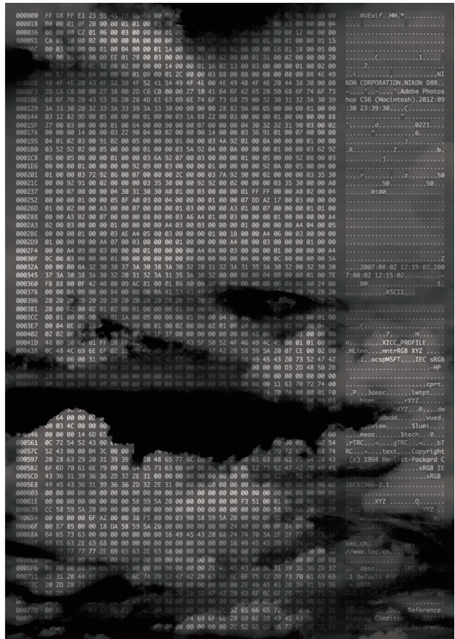
元画像/バイナリエディタ[0xED]によるコード16進数での表示(イメージ)