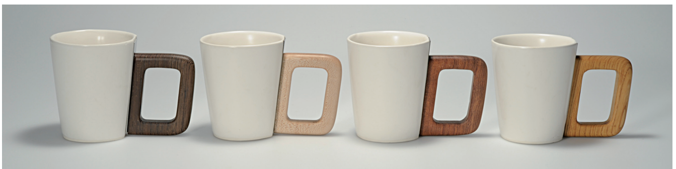
作品名/Totte totte/NUAS DESIGNERS EXHIBITION/2012年/サイズ: コップ・90×110 取手・55×90/素材: 磁器土・木材